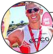
Rasmus Henning Dinamarca Campeón de Europa Olimpico con Dinamarca