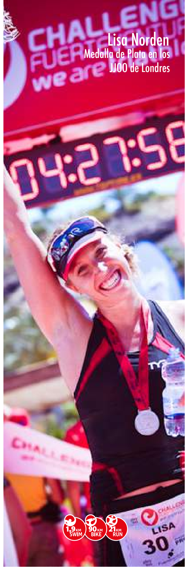
Lisa Norden Medalla de Plata en los J100 de Londres