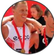
Rasmus Henning Dinamarca Campeón de Europa Olimpico con Dinamarca